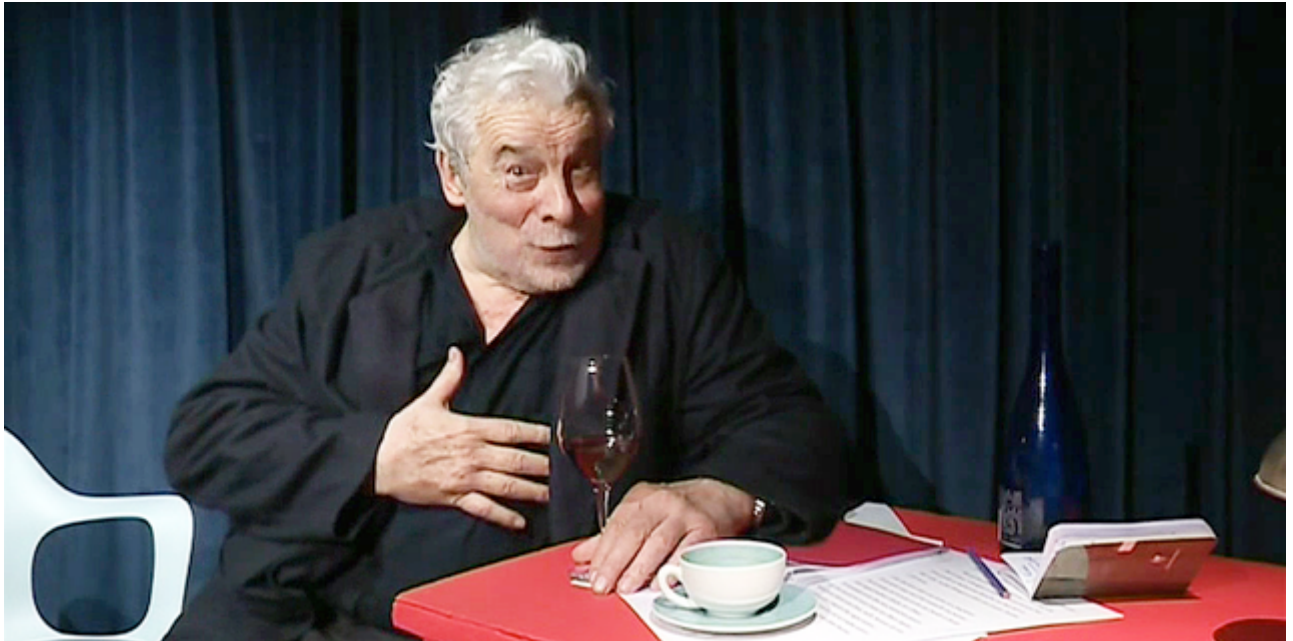
Jacques Weber est l'affiche de "Hugo au bistrot" au restaurant la scène Thélème

Le comédien Jacques Weber a choisi un lieu original pour créer sa nouvelle pièce. "Hugo au bistrot" est jouée en ce moment à Paris, à la scène Thélème, un restaurant-théâtre près de la place de l'Etoile. Casser les habitudes, faire voyager les plus grands textes d'Hugo et déguster un repas gastronomique, le concept séduit les amateurs de mots et de mets. A voir jusqu'au 5 mai puis en tournée.